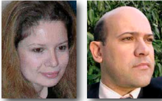
Επιμέλεια: Βάλυ Χατζηδάκη '94 Πάρις Βαλλίδης '82

Αυτό το αφιέρωμα-παρουσίαση των συναποφοίτων οι οποίοι υπηρέτησαν τους Ολυμπιακούς Αγώνες της Αθήνας, είτε ως οργανωτικά στελέχη στον "Αθήνα 2004" είτε σε άλλες θέσεις-κλειδιά, ξεκίνησε να συντάσσεται την εποχή που ο φόρτος εργασίας γι' αυτούς ήταν στο μέγιστο. Σας παρουσιάζουμε λοιπόν όσους ανταποκρίθηκαν, μέσα στα περιορισμένα για όλους μας χρονικά περιθώρια μέχρι τη στιγμή της εκτύπωσης. Ούτως ή άλλως το αποτέλεσμα και η εικόνα μίλησε μόνη της.